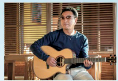
ギターを持つての撮影時 「Fly me to the Moon」をさらっと弾き語り。

「3月31日の福岡公演、どんなライブにしたいですか?」 杉山 とにかく楽しい時間を過ごして欲しい。僕らが楽しい、みんなが楽しい。それが一番だね!