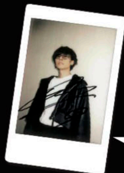
写真プレゼント 応募方法は P.11をチェック!

ずっと聴いていたんですよ。で、その人たちの歌う。波紋感。っていうのがとにかく凄くて。結構影響を受けたんじゃないかと思えますね。そんな彼らは現在、Sleepless in Japan Tour、の真・最中だ。つい先日、Zepp Fukuokaでの公演が終わったばかりだが、5月にはマリンメッセ福岡でのアリーナ公演が決定している。「なんせ、うちら飽き性なんでね(笑)。Zeppとマリンメッセではまた全然変わっていると思うし、気合も新たに直して、お客さんと一緒に盛り上がりていきたいと思えますので、是非、楽しみにしていて下さい」。